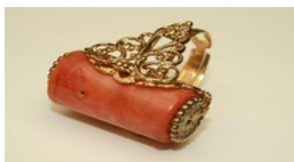
Le collezioni handmade del marchio storico Ornella Bijoux